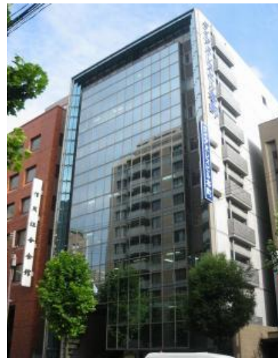
本町通りから見た外観