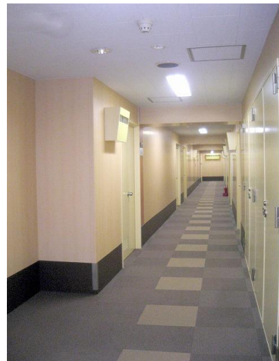
2008年に大規模修繕を実施した共用廊