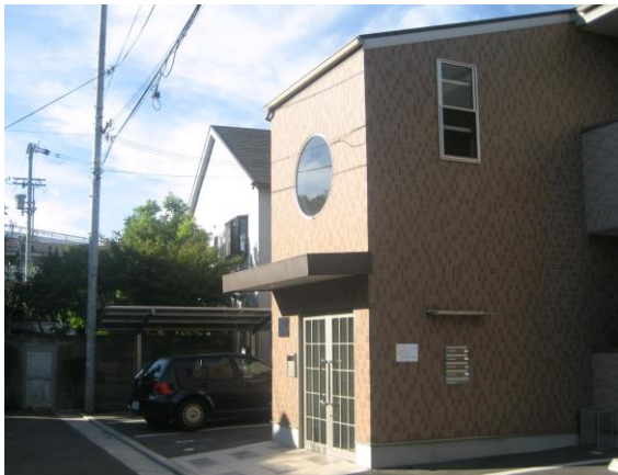
おしゃれな外観と安全を守るカラーモニター付オートロックでエントランスを演出